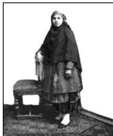
تصویر ۵: چارقد