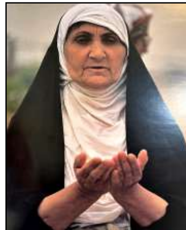
تصویر ۱۶: مقنا و چادر، منبع: تحویلدار، ۱۳۹۲: ۱۶۸