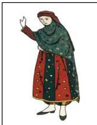
تصویر ۶: چارقد، منبع: دانشور، ۱۳۷۶: ۱۸

- چارقد: چارقد، دستمالی کلاغی یا سفیدرنگ است که زنان آن را لچکی کرده و بر روی مکنای مانند عمامه بسته و دوسر آن نیز از پشت آویزان می‌شود. در گذشته بانوان برای محافظت سر و گردن از سرما و نیز برای استوارماندن مکنای آن را می‌بستند، تا مکنای جابه‌جا نشود که البته امروزه منسوخ شده است (دانشور و بهنام، ۱۳۷۶: ۱۸). (تصویر ۵ و ۶)