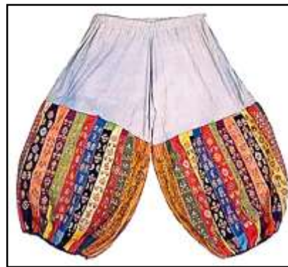
تصویر ۱۰: شلوار