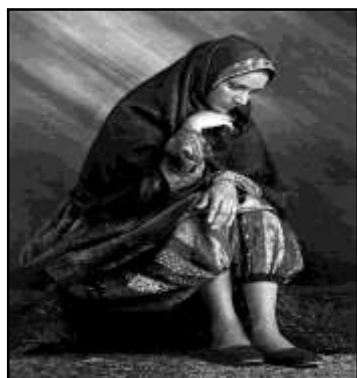
تصویر ۱۱: شلوار، منبع: نمیرانیان، ۱۳۹۱: ۶۵

- شلوار، شوال: این شلوار از جنس کتان و پنبه بوده و از کمر به پائین حدود ۱۵ سانتی‌متر از پارچه‌ای متفاوت با پارچه ساق شلوار دوخته و ساق‌های شلوار را به بجای یک تکه بودن، از پارچه‌های باریک، رنگارنگ و نقش‌دار ترکیب و پهلوی هم دوخته و به شکل ساق شلوار در می‌آورند. این شلوار لیفه‌ای بوده و با بندی به‌دور کمر و مچ پا جمع می‌شود (گریفیث، ۱۹۰۹: ۱۲۷).