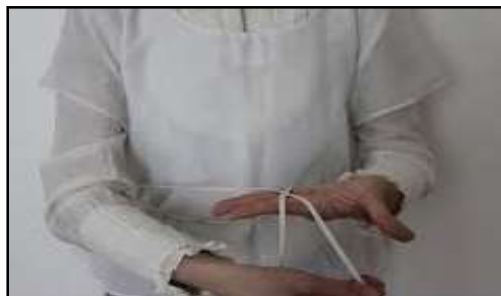
تصویر ۷: سدره و کشتی