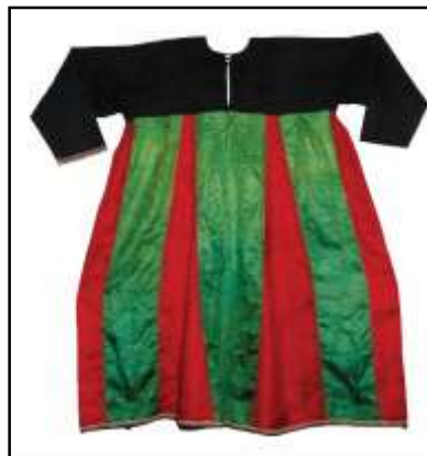
تصویر ۹: خمیس و شلوار