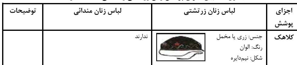
جدول ۱: تطبیق اجزای پوشش زنان زرتشتی و مندائی. مأخذ: نگارنده