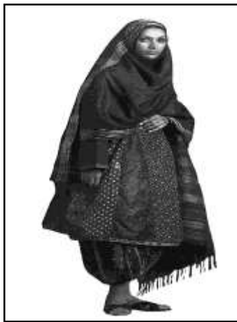
تصویر ۴: مکنای، منبع: نمیرانیان، ۱۳۹۱: ۱۳

۱۳۷۳: ۹۳) مکنای تک‌رنگ و گاه طرح‌دار بوده و ریشه‌هایی به رنگ‌های زرد، سبز و سیاه دارد و جنس پارچه آن را نیز معمولاً از نوعی انتخاب می‌کنند که سر نخورد (آن‌والا، ۱۹۵۱: ۱۴). برای گذاردن مکنای بر سر، فرد باید ابتدا آن را به طور آزاد روی دو دست خود قرار داده و در حالی که مکنای از دو طرف دستش به یک اندازه آویزان است، وسط آن را جلوی صورت و چانه قرار دهد (نمیرانیان، ۱۳۹۱: ۱۰). مکنای سر، مو و گوش‌ها را پوشانده و فقط قرص صورت پیداست و موهای سر کاملاً پوشیده می‌شود. قسمت جلوی مکنای سینه را پوشانده و دو گوشه آن نیز از پشت تا ساق پاها آویزان می‌باشد (محمدی، ۱۳۹۶: ۱۱۳). مکنای به گونه‌ایست که کاملاً سر، پشت و جلو بدن را محفوظ نگه می‌دارد و از جلو بر روی دست افتاده و تا بالای مچ دست را می‌گیرد؛ در نتیجه مانند چادر است و برجستگی و فرورفتگی‌های بدن را می‌پوشاند. رنگ مکنای نیز در خود نشانه‌ها و علاماتی را به همراه دارد؛ به عنوان مثال مکنای قرمز و رنگی، نشان از تجرد و مکنای سبز نماد تأهل هستند. «کیش»، مکنایی حاشیه‌دار است و رنگی زرشکی دارد و «داریبی» مکنایی سبز رنگ است که بر سر عروس انداخته می‌شود و در حجله داماد آن را از سر عروس برمی‌دارد (تصویر ۳ و ۴).