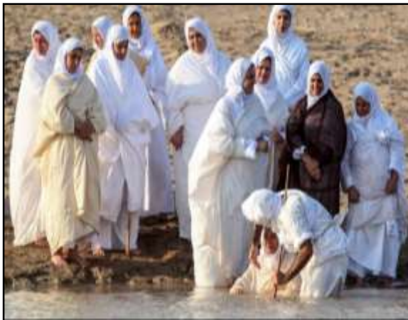
تصویر ۱۷: چادر عبایی، منبع: mohammad.ahangar.ir