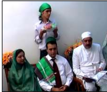
تصویر ۱۳ و ۱۲: مکننا و شال سبز عروس، عکس از نگارنده

- لباس مراسم ترحیم: در اکثر نقاط جهان و در بیشتر ادیان، افراد در مرگ عزیزان لباس سیاه می‌پوشند، برخی بر این عقیده‌اند که رنگ سیاه از نظر روانی حزن‌آور و متناسب با حال و هوای غمناک و ماتم است و به همین علت در اکثر نقاط جهان به نشانه غم و اندوه در مرگ عزیزان لباس سیاه استفاده می‌شود. اما مرگ در کیش زرتشتی پایان زندگی نیست، بلکه آغازی برای شادی روان است. به همین جهت، پوشیدن لباس تیره و سوگواری بر مرگ متوفی پسندیده نبوده (رئیس-السادات و دادبخش، ۱۳۹۸: ۸۳) و زرتشتیان در مراسم تشییع جنازه، مانند تمامی مراسم و جشن‌های خود، از البسه سفید استفاده می‌کنند، زیرا این رنگ را نماد روشنی، پاکی و خلوص می‌دانند (هینلز، ۱۳۸۷: ۶۰) زرتشتیان بعد شست‌وشوی جسد با آب و گلاب و پوشاندن کفن سفید و تجدید کشتی، میت را دفن می‌کنند (مزدایور، ۱۳۸۳: ۱۵۸).