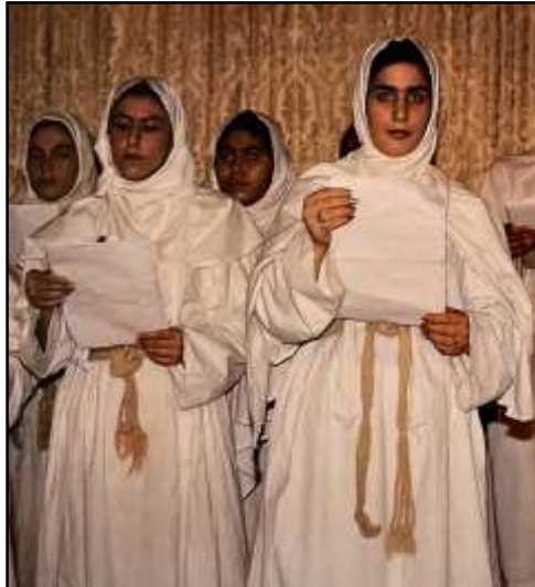
تصویر ۱۸: مقنا، سدره و همیانه

دنیوی است (یکتایی، ۱۳۴۰: ۸). کاربرد این کمر بند و استفاده از آن، نماد اطاعت و بندگی خدا و دور شدن از شر و بدی‌های دنیوی است؛ به همین دلیل بستن آن هنگام انجام دادن مراسم مذهبی و دینی، از واجبات می‌باشد (تصویر ۱۸).