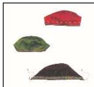
تصویر ۱: کلاه، منبع: نمیرانیان، ۱۳۹۱: ۶۵