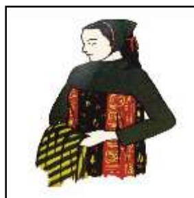
تصویر ۲: لچک، منبع: دانشور، ۱۳۷۶: ۱۸