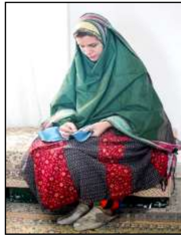
تصویر ۳: لچک و مکنای، منبع: www.amordadnews.com.

- چارقد: چارقد، دستمالی کلاغی یا سفیدرنگ است که زنان آن را لچکی کرده و بر روی مکنای مانند عمامه بسته و دوسر آن نیز از پشت آویزان می‌شود. در گذشته بانوان برای محافظت سر و گردن از سرما و نیز برای استوارماندن مکنای آن را می‌بستند، تا مکنای جابه‌جا نشود که البته امروزه منسوخ شده است (دانشور و بهنام، ۱۳۷۶: ۱۸). (تصویر ۵ و ۶)