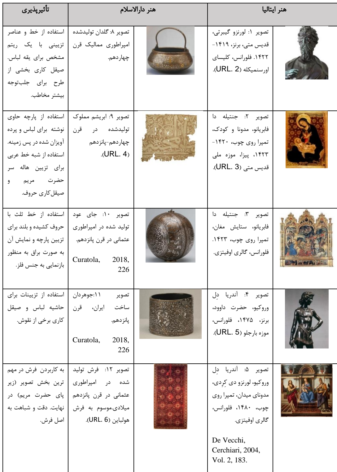
جدول ۱. تحلیل آثار نمودار ۱ از حیث تأثیرپذیری بصری

نمودار ۱. تطبیق زمانی مهم‌ترین امپراطوری‌های دارالسلام و سلسله مدیچی به همراه آثار معرف جنبش «به سبک شرقی» در توسکانی و منبع الهام‌گیری بصری