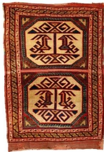
تصویر ۲. فرش ماربی پیدا شده در کشور سوئد، قرن ۱۴-۱۶ میلادی، استکهلم، موزه ملی عتیقه‌جات. شماره: SHM17786. (منبع: URL 1).

شکی نیست که این فرش الهام گرفته شده و برداشتی نوین از یکی از فرش‌های موسوم به «ماربی» است. این مدل فرش در جغرافیای آناتولی تحت سلطه سلجوقیان و عثمانیان - قرن چهاردهم تا شانزدهم میلادی - بافته می‌شد (فرانسس، ۲۰۱۳: ۲۶۰). این مدل فرش دارای دسته بندی‌های متفاوتی از دیدگاه طراحی است اما معروف‌ترین آن، نقوش حیوانی است که یکی از قدیمی‌ترین نمونه‌های آن در سال ۱۹۲۵ میلادی در کلیسای متروکه ماربی در کشور سوئد پیدا شد و به همین خاطر به همین نام معروف شد (ویگت، ۲۰۲۲: ۴). این مدل دارای قاب‌های هشت ضلعی است که در هر قاب نقش پرندگان روبه‌روی یکدیگر قرار دارند که بین آن‌ها درخت زندگی نمایش داده شده است (تصویر ۲).