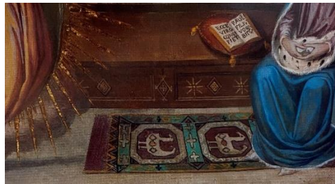
تصویر ۱. هنرمند ناشناس، لحظه بشارت (بخشی از اثر)، نقاشی دیواری، فلورانس، باسیلیکای سنتیسیما آنونزیاتا، قرن چهاردهم-پانزدهم میلادی.

در قرن پانزدهم میلادی و همزمان با درخشش شهر فلورانس و تبدیل شدنش به یکی از مهم‌ترین مراکز هنری کشور ایتالیا، نمایش اشیاء اسلامی در آثار هنرمندان این شهر - خصوصاً نقاشی - اهمیت ویژه‌ای یافت. اولین تلاش هنرمندان برای پیوستن به این جنبش با بازآفرینی تصاویر فرش در نقاشی شروع شد (سریشاری، ۲۰۰۴: ۳۳۵). قدیمی‌ترین اثری با این مضمون که در دست است، نقاشی دیواری «لحظه بشارت» از هنرمندی ناشناس است که امروزه در یکی از باسیلیکاهای ۱ شهر فلورانس قرار دارد (تصویر ۱).