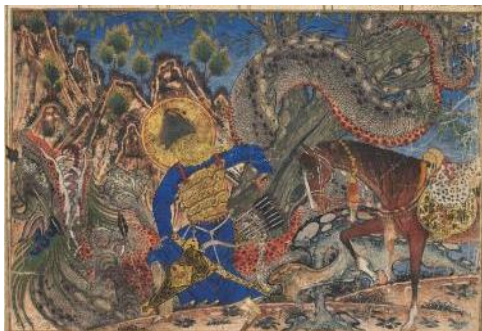
تصویر شماره یک: نگاره بهرام گور اژدها را می‌کشد

در شاهنامه بزرگ ایلخانی تعداد ۵ نگاره به موضوع بهرام گور در موقعیت‌های گوناگون پرداخته‌اند. این نگاره‌ها شامل: ۱- نگاره‌ی بهرام گور اژدها را می‌کشد، موزه‌ی هنر کلیولند، اوهایو. ۲- نگاره‌ی جنگ بهرام گور با گرگ شاخ‌دار، موزه‌ی هنر دانشگاه هاروارد. ۳- نگاره‌ی بهرام گور و آژدها، موزه‌ی هنر دانشگاه هاروارد. ۴- نگاره‌ی سخن گفتن بهرام گور با نرسی، موزه‌ی هنر و تاریخ جنوا، ایتالیا. ۵- نگاره‌ی بهرام گور در خزانه‌ی جمشید، انستیتو اسمیتسون، واشنگتن دی سی. هستند که در ادامه به بررسی آنها پرداخته می‌شود.