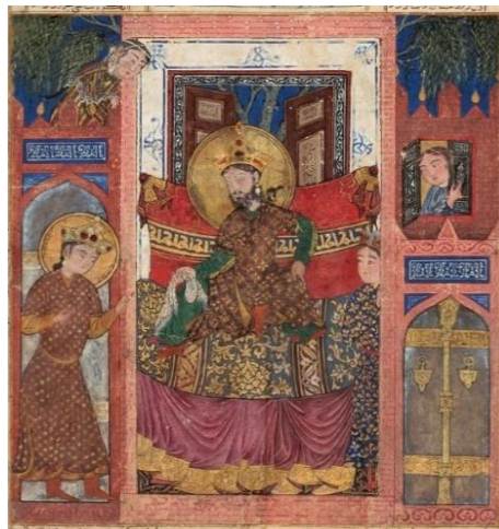
تصویر شماره چهار: سخن گفتن بهرام گور با نرسی، منبع: https://www.clevelandart.org/art/