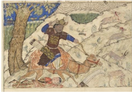
تصویر شماره سه: بهرام گور و آزاده در حال شکار؛ کتابخانه دانشگاه هاروارد، ثبت به شماره ۱۹۵۷.۱۹۳