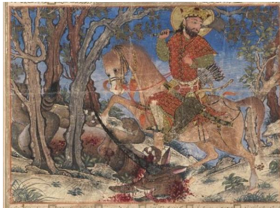
تصویر شماره دو: نبرد بهرام گور با گرگ شاخدار؛ کتابخانه دانشگاه هاروارد، ثبت به شماره ۱۹۰.۱۹۶۰