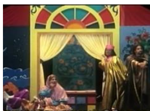
تصویر ۹: صورتی (۱۳۸۱)

مجبور به زن‌پوشی می‌کنند (فیلم شاخه گلی برای عروس (۱۳۸۳)). در فیلم مزاحم (۱۳۸۰) در هنگام گره‌گشایی فیلم و برداشتن نقاب زنانه، نوید مردانگی‌اش را با نشان دادن اسلحه و کاربرد آن در سوسک کشتن نشان می‌دهد: «نوید: نترسیا من سوسک هارو می‌کشم با این». در این فیلم، نیما یک شخصیت منفی بوده و در پایان در بغل مرد سوپر استار می‌گرید (تصویر ۸) عنوان فیلم نیز بازگوکننده ایدئولوژی انضباط حاکم بر داستان است. در فیلم صورتی (۱۳۸۱) ساخته فریدون جیرانی، زن‌پوشی به منزله پیرنگی فرعی عملکرد دارد زیرا در آن مرد به واسطه ایفای نقش تئاتر زن پوش شده تا کلیشه سازی‌های مادرانه را طنازانه به تصویر بکشد (تصویر ۹).