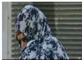
تصویر ۲: آخر خلاف (۱۳۹۰)