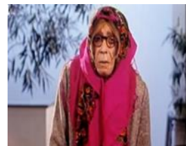
تصویر ۱: کلاهی برای باران (۱۳۸۵)