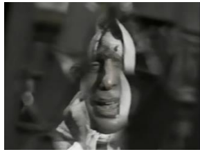
تصویر ۱۱: دستفروش (۱۳۶۵)