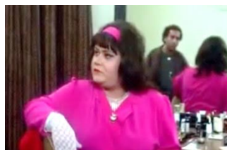
تصویر ۵: آدم برفی (۱۳۷۳)