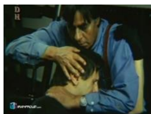
تصویر ۸: مزاحم (۱۳۸۰)