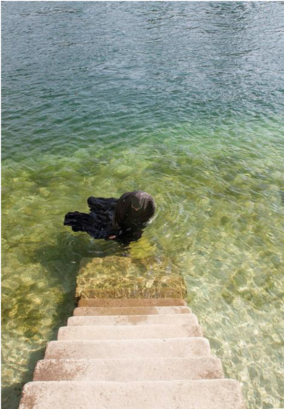
تصویر ۴: URL 2-Parastou Forouhar 2017