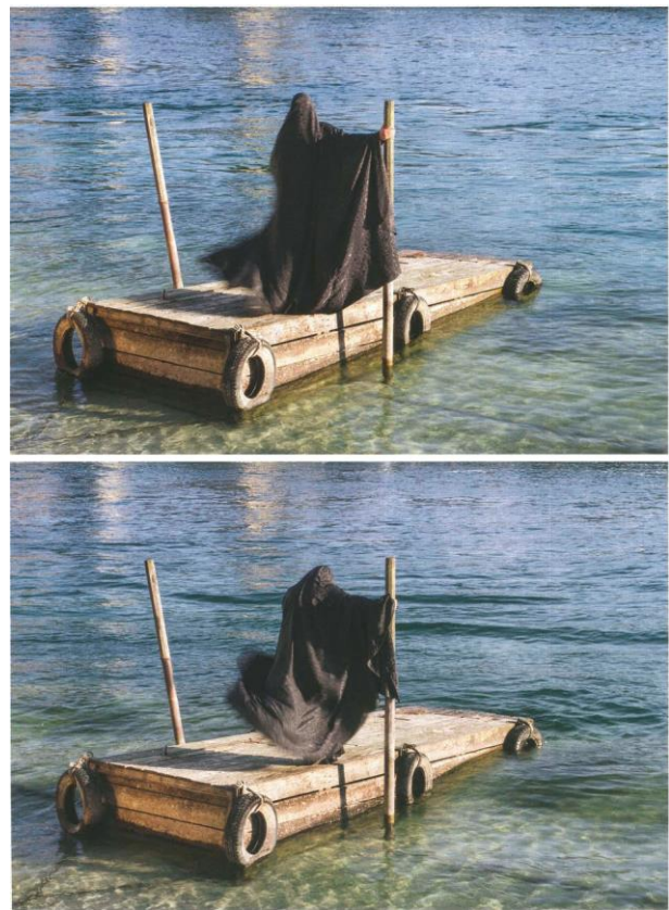
تصویر ۳: URL 2- Parastou Forouhar 2017