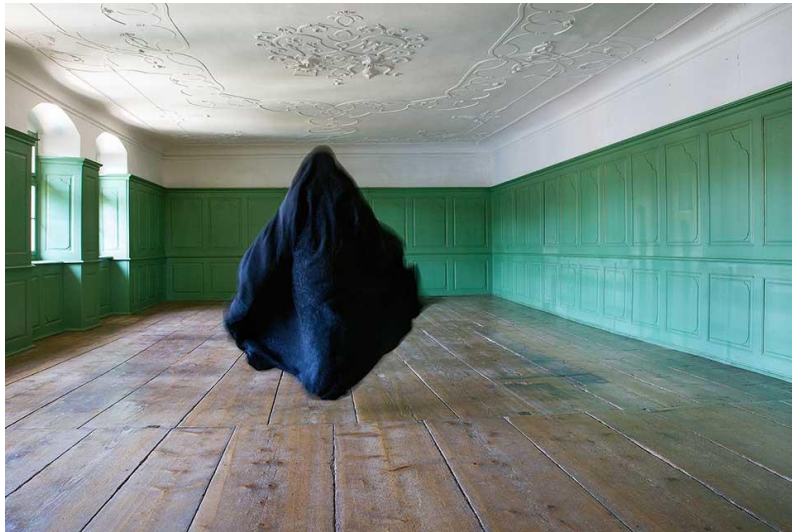
تصویر ۲: URL 2- Parastou Forouhar 2017