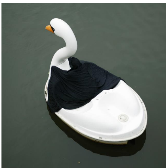
تصویر ۱: Parastou frouhar Swanrider.2004: URL 1-

پرستو فروهر هنرمند ایرانی دهه ۶۰ است. این نسل بخصوص در دوره ای قرار گرفتند که تجربه و حوادث بعد از انقلاب و جنگ ایران و عراق را تجربه کردند و بسیاری از آنها دست به مهاجرت زدند. این افراد با اسکان مجدد در سراسر جهان گروه‌های متعددی از جوامع دیاسپوریک به ویژه در ایالات متحده آمریکا، فرانسه، آلمان و انگلیس را تشکیل دادند و بدین ترتیب یک دیاسپورای جهانی متنوع ایرانی را شکل دادند. پرستو فروهر در سال ۱۹۹۱ ایران را به قصد تحصیل در دانشگاه هنر و طراحی HFG در آفنباخ آلمان در رشته هنر ترک کرد و فعالیت هنری خود را در زمینه مسائلی مانند آزادی بیان، حقوق بشر و اتفاقات و جریان‌های سیاسی روز جهانی ادامه دارد. کاوش او در تکنیک‌های مختلف از جمله اینستالیشن، انیمیشن، طراحی و دیجیتال