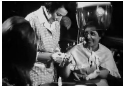
تصویر ۱ - روند تبدیل آتش به ستاره‌ای برساخته و فتیشیزه شده.

با اتمام فرایند آماده‌سازی ستاره، زمان نخستین اجرای آتش در مقابل توده تماشاگران در کاباره شاهین فرا می‌رسد. اجرایی که با استقبال و تشویق تماشاگران همراه می‌شود. تمهیدات سینمایی که فیلمساز در این صحنه به کار می‌گیرد، به روشنی بحث مالوی در رابطه با ستاره به‌مثابه کالایی برای مصرف توده را متبادر می‌سازد. تصویری از آتش در حال اجرا بر روی تصویر توده تماشاگرانی که او را تشویق می‌کنند، دیزالو می‌شود. سپس فیلمساز تصویری از فرایند برساخته شدن او به‌مثابه ستاره (آموختن خوانندگی تحت نظارت شاهین) را بر تصاویر اجرای کنونی‌اش بر روی صحنه دیزالو می‌کند. سپس تصویری از تشویق توده تماشاگران و دسته گل‌های هدایی‌شان بر روی تصاویر قبلی می‌آید. با این تمهید فیلمساز اهمیت فرایند ستاره‌سازی، در موفقیت و محبوبیت آتش نزد توده تماشاگران هنگام اجرا بر روی صحنه را برجسته می‌سازد. آتش به یک ستاره، به یک کالا برای مصرف توده تبدیل شده است (مالوی، ۲۰۱۱: ۲۵). با این حال، این عملکرد و سازوکار شاهین در پشت صحنه است (کشف، آماده‌سازی، ارایه کردن، تبلیغ کردن) که آتش را به‌مثابه یک ستاره، یک کالا، برای مصرف توده، تولید می‌کند (تصویر ۲). هنگام اجرای آتش بر روی صحنه، در حالیکه آتش در مرکز کادر برای توده تماشاچیان در حال اجراست، در گوشه سمت چپ کادر،