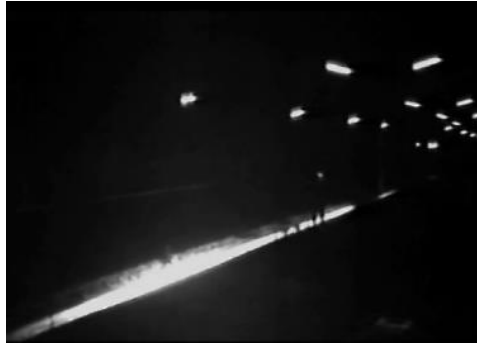
تصویر ۵ - محو شدن شاهین در تاریکی شبانه شهری.