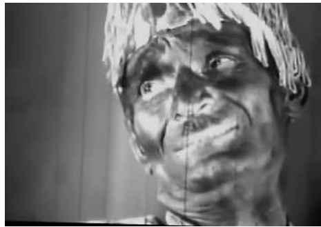
تصویر ۴ - هنرمندان طرد و رانده شده از صنعت سرگرمی.