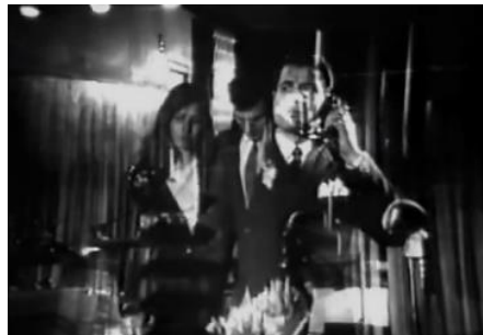
تصویر ۳ - اعمال قدرت شاهین در راستای حذف و طرد ستاره‌ها.

گذاشته می‌شود. در این فصل، نماهایی از شاهین و دستیارش جاسم در حال صحبت با تلفن، بر روی نماهایی از اخراج آتش و افشین از کاباره‌های مختلف دیزالو می‌شود. در این بخش، دستگاه تلفن به‌مثابه یک تکنولوژی ارتباطی به نمایش در می‌آید که از طریق آن قدرت شاهین اعمال می‌شود. بواسطه این تماس‌ها، تمامی درها بر روی آتش و افشین بسته می‌شوند، و آنها از کاباره‌های مختلف اخراج می‌شوند (تصویر ۳). از این منظر، شخصیت شاهین را می‌توان تجسیدی از خود کارگردان و صنعت فیلمسازی در نظر گرفت که ستاره‌های خود را خلق می‌کند، و همچنین از این قدرت برخوردار است که آنها را طرد کند و به افول وادارد. در همین راستا، در صحنه‌ای دیگر، به دستور شاهین، افراد وی پوستره‌های آتش را از روی دیوارها پایین کشیده، و در میان شعله‌ها می‌اندازند. دوربین برای لحظاتی، پوستری که نمای نزدیکی از چهره آتش را نمایش می‌دهد، در حال سوختن در میان شعله‌ها را در قاب می‌گیرد. این پوستر همان تصویری از آتش است که شاهین در غیاب وی در خانه با آن مواجه شده بود. با در نظر داشتن پیوند تنگاتنگ ستاره و تصویر وی، به نظر می‌رسد این از بین بردن تصاویر و پوستره‌های آتش، دلالتی به حذف و طرد وی از جایگاه ستارگی دارد. در دیالوگی دیگر، شاهین آتش را تهدید می‌کند که: «فراموش نکن که این آتش رو من خودم شعله‌ور کردم، و خودمم می‌تونم خاموشش کنم». در این مکالمه مفهوم شعله‌ور کردن، به فرایند ستاره‌سازی اشاره دارد، و عمل خاموش کردن نیز به طرد و واپس‌راندن از این صنعت دلالت می‌کند.