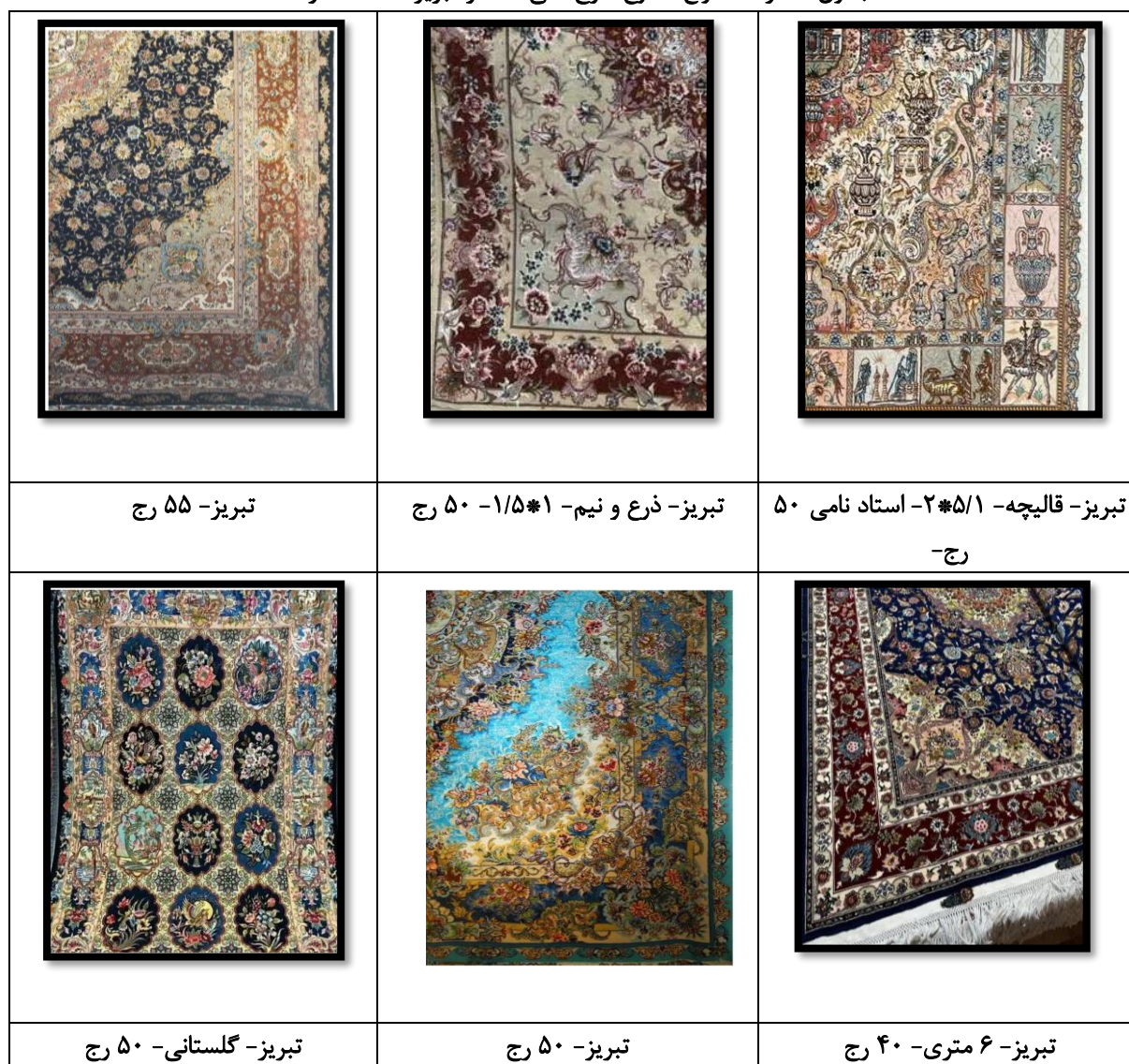
جدول شماره ۱: انواع متنوع طرح قالی معاصر تبریز

مولفه‌های قالی معاصر برمبنای مبانی نظری معاصر را می‌توان در یکنواختی و هماهنگی فضاها در کل زمینه متن فرش، ترکیب اجزای اسلیمی و ختایی، تلاش در جهت برجسته‌نمایی و عمق بخشیدن به نقوش و وحدت بین عناصر طراحی و فضا و رعایت اصول فنی طراحی قالی و از همه مهم‌تر تنوع و تلفیق عناصر سنتی با نقش‌مایه‌های سنتی و واقع‌گرا، گرایش به نشان داده تصویر واقع‌گرا و طبیعت‌پردازانه با استفاده از نقش‌مایه (گلفرنگ) گل و مرغ و اهمیت تصویرپردازی، همگامی هنرمندان با هنر مدرن