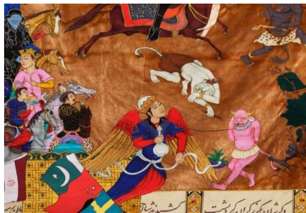
تصویر ۷: What Now My Friend، خادم علی، مأخذ: (url3).

خادم علی، با بهره‌گیری از سنت‌های تصویری نگارگری فارسی-هندی و ترکیب آن با مفاهیم معاصر، سبک منحصر به فردی خلق کرده است. عناصر تزئینی در آثار او هم نقش زیبایی‌شناسانه دارند و هم لایه‌های مفهومی اثر را تقویت می‌کنند.