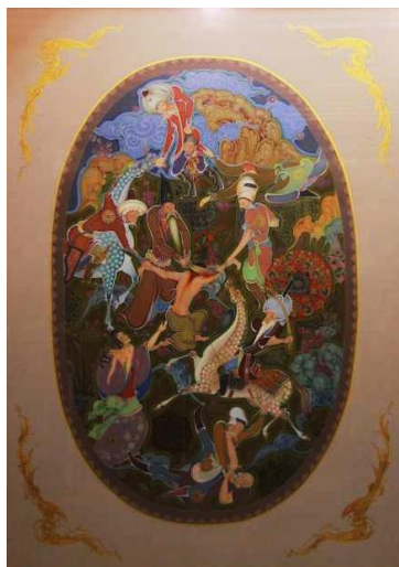
تصویر ۲: وارثان ولایت، مجید مهرگان، مأخذ: (متقی و بهادرانی، ۱۴۰۳: ۴۲).

یکی دیگر از آثار شاخص مهرگان اثر وارثان ولایت است که در آن، مفاهیم دینی و عرفانی با ظرافت خاصی به تصویر کشیده شده‌اند. در این نگاره، استفاده از رنگ‌های طلایی و آبی، همراه با تذهیب‌های دقیق، فضای روحانی و ملکوتی را القا می‌کند (تصویر ۲).