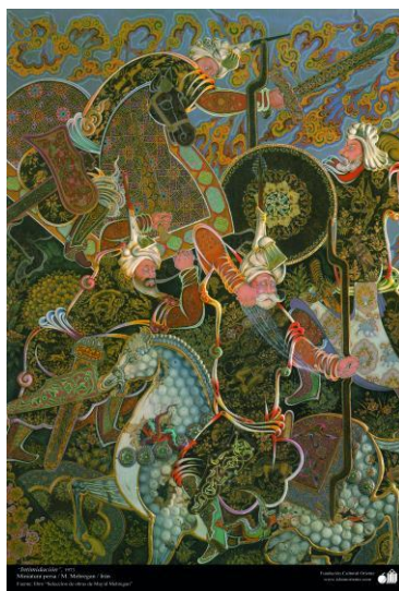
تصویر ۱: ارباب، مجید مهرگان، مأخذ: (متقی و بهادرانی، ۱۴۰۳: ۴۲).

مجید مهرگان (زاده ۱۳۲۴ در رشت) یکی از برجسته‌ترین نگارگران معاصر ایران است که با آثارش نقش مهمی در احیای هنر نگارگری ایرانی ایفا کرده است. مهرگان با الهام از اساطیر ایرانی و مفاهیم عرفانی، آثار نگارگری خلق کرده است که بیانگر درک عمیق او از هنر ایرانی است. او با بهره‌گیری از رنگ‌ها و طراحی‌های خاص خود، نگاره‌های سنتی را با بیانی نو و معاصر ارائه می‌دهد. اگرچه تحت تأثیر استادانی مانند محمود فرشچیان آموزش دیده است، اما سبک شخصی و متمایزی در نگارگری ایرانی دارد و دراماتیک‌تر و روایت‌محورتر است. برخی منتقدان هنری او را به نوعی "راوی تصویری" در هنر ایرانی می‌نامند (ماه هنر، ۱۳۸۲: ۲۲). هویت ایرانی-اسلامی، اسطوره‌های شاهنامه، عشق و سلوک عرفانی و نبرد خیر و شر از جمله موضوعاتی است که مهرگان در آثارش به آن‌ها می‌پردازد. نگاره‌های او اغلب سرشار از جزئیات پیچیده، چهره‌هایی با نگاه‌های معنادار، و رنگ‌هایی لطیف اما عمیق‌اند. نگاره ارباب (تصویر ۱) صحنه‌ای از نبرد حماسی را به تصویر می‌کشد که با الهام از داستان‌های شاهنامه خلق شده است. در این اثر، استفاده از رنگ‌های تیره و خطوط قوی، حس حرکت و تنش را به خوبی منتقل می‌کند. تحلیل‌گران هنری، این اثر را نمونه‌ای از به‌کارگیری نظریه‌های گشتالت در نگارگری ایرانی می‌دانند.