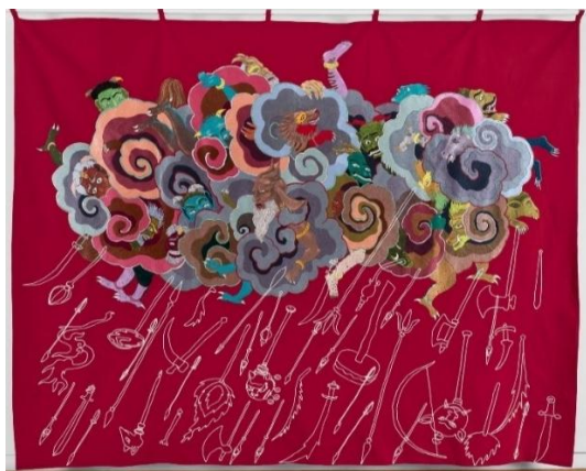
تصویر ۵: Birth of Demon، خادم علی.