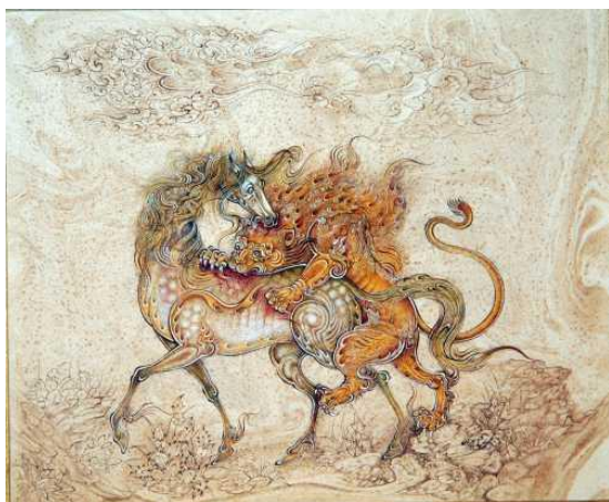
تصویر ۴: نبرد شیر و اسب، مجید مهرگان.

مجید مهرگان در آثار خود، به‌ویژه در نگاره‌هایی مانند «نبرد رستم با دیو» و «نبرد شیر و اسب» (تصویر ۳ و ۴)، به بازآفرینی داستان‌های اسطوره‌ای پرداخته است. در این آثار، ترکیب‌بندی‌های پیچیده و استفاده از رنگ‌های زنده، حس حماسی و دراماتیک را به‌خوبی منتقل می‌کند.