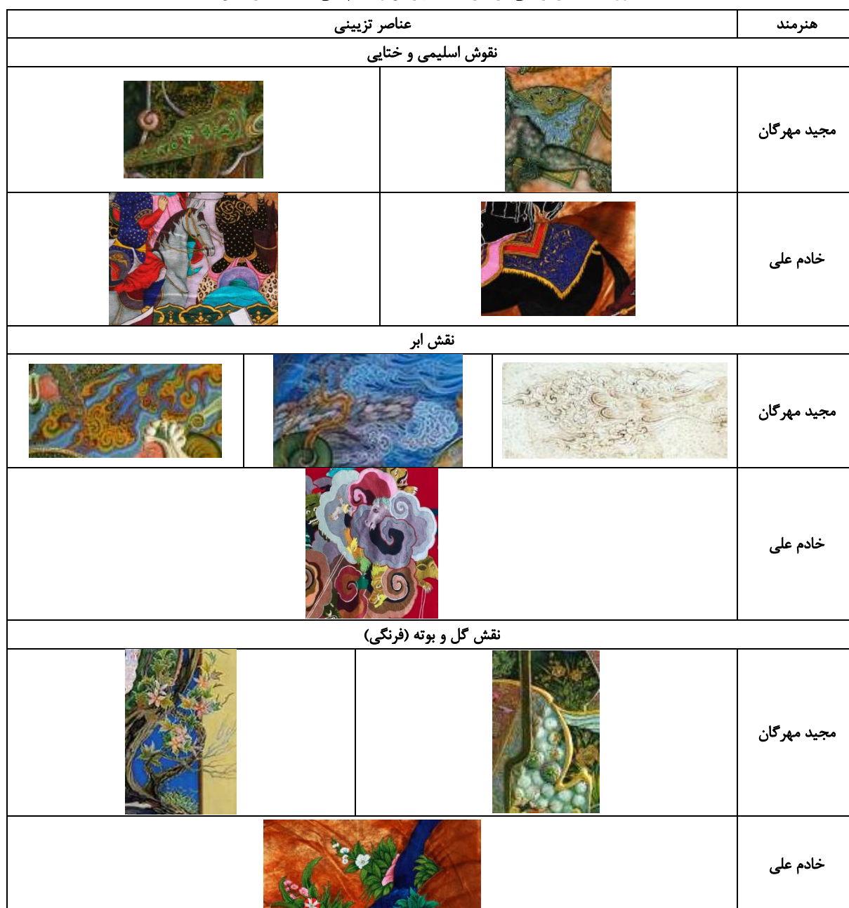
جدول ۳: عناصر تزئینی در آثار مجید مهرگان و خادم علی.

گروسی، عاطفه؛ شایسته‌فر، مهناز؛ مهدی‌زاده، علیرضا (۱۴۰۵). تحلیل تطبیقی عناصر تزئینی و بازتاب زمینه‌های فرهنگی در آثار نگارگری مجید مهرگان و خادم علی. جامعه‌شناسی فرهنگ و هنر، ۸ (۱)، ۱-۱۴